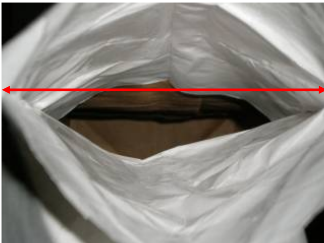
此为从阀口(即粉体充填口)拍的照片，此宽度为阀口尺寸

者两种袋子内部结构都相同，差别在于，有外阀口的气密性较佳，适合用于高单价，易受潮的粉体