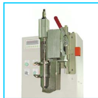
充填头手动升降，枪头高度快速定位