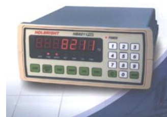
台湾原装进口高性能控制仪表