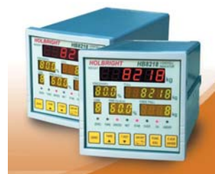
台湾原装进口高性能控制仪表