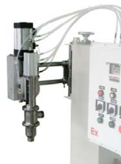
自动升降充填枪头，手动高度调整